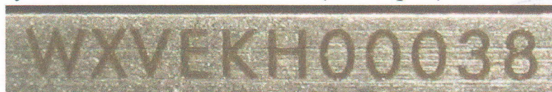
Зображення 6. Збільшений вигляд маркування на руків'ї.

Руків'я виготовлено з твердого полімерного матеріалу коричневого кольору, з'єднано між собою за допомогою двох гвинтів (з кожної сторони по два). Довжина руків'я 67мм, найбільша ширина 14мм, найбільша товщина 9мм. В задній частині руків'я є металевий виступ навіл овальної форми з наскрізним отвором через який продіто металеве кільце. На руків'ї (на його ребрі) є маркування «WXVEKN00038» (на зобр. 6).