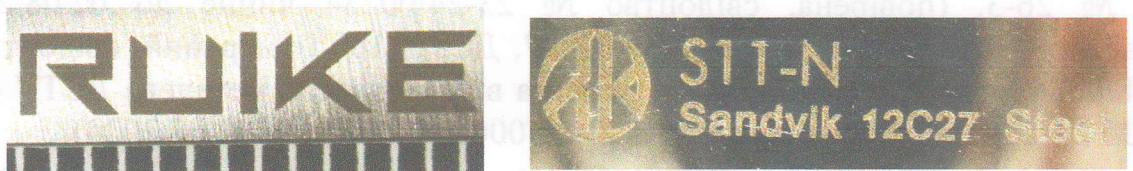
Зображення 5. Збільшене зображення маркувальних позначень на клинку.

Зображення 3, 4. Загальний вигляд ножа в бойовому положенні з однієї та іншої сторони.